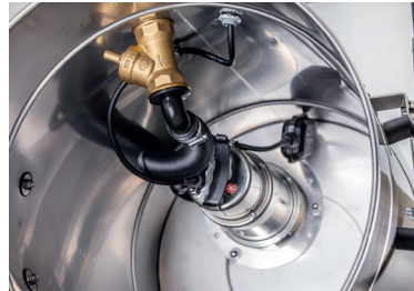
Mit fest eingebauter Edelstahl-Tauchpumpe

3,5 m Saugschlauch Ø 50 mm und Fugendüse.