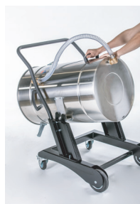
Behälter mit Kippfunktion

3,5 m PUR-Saugschlauch Ø 50 mm, Fugendüse und Spänekorb.