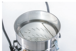
60 Liter Spänekorb (inklusive)