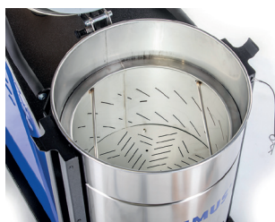
60 Liter Spänekorb (inklusive)

2 m ölfester Ablassschlauch mit Kugelhahn, 3,5 m PUR-Saugschlauch Ø 50 mm, Fugendüse und Spänekorb.