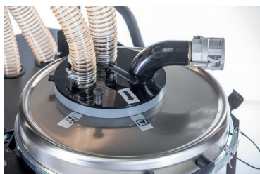
Bedieneinheit der Schubumkehr zur Behälterentleerung (Flüssigkeiten).