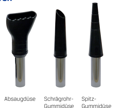
Absaugdüse Schrägröhr-Gummidüse Spitz-Gummidüse